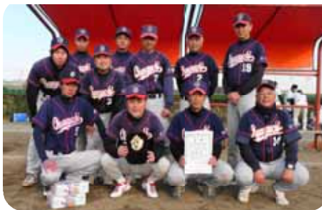
【準優勝の大谷口PTAソフト】

◎全員で試合をしました。一人欠けても勝てません。試合に出られない人も応援には必ず来ます。今回の初優勝は大変嬉しく思っています。来年も優勝を目指し頑張ります。