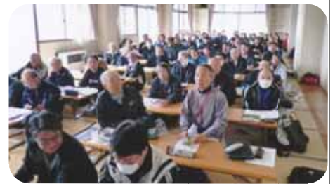
〔記念館でのルール研修会〕

午後の実技は強風に見舞われ砂埃があまりにも酷いので1時間程度で中止し、残りの実技講習については地区毎に責任者が指導することにして残念ながら閉講となった。今年度の主なルール改正点は「故意四球」と「コールドゲームで、3回15点、4回10点」が採用になったと説明があった。