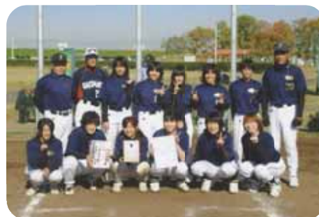
【準優勝の与野レンジャーズ】