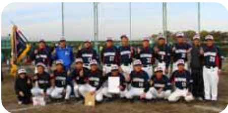
【春・秋優勝のさいたま65】

◎きびしい試合でしたが、各々が自信を持ち、チーム一丸となって優勝を勝ち取りました。