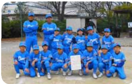
【準優勝・さくらフェニックス】