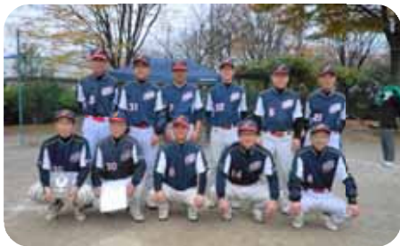
【準優勝の城北小ソフトクラブ】

◎チーム全員の力が一つになり、春・秋と連覇することが出来ました。まだまだ発展途上のチームですので、この優勝に満足せず、練習してゆく所存です。