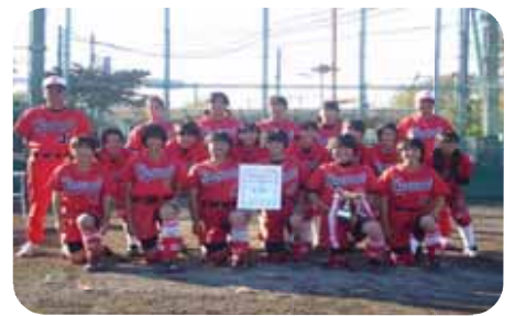
【新人戦2連勝の春里中学校】