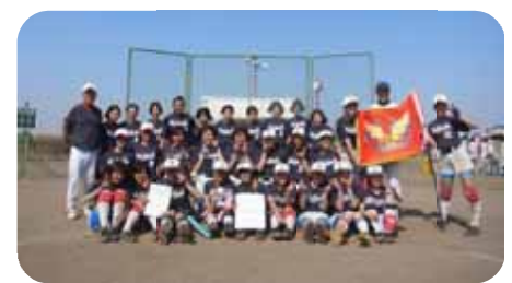
【冬季大会初優勝の植竹中学校】