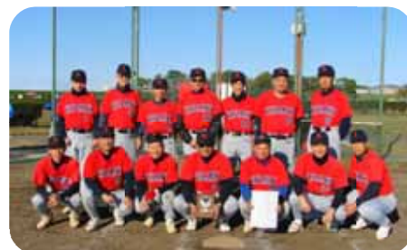
【準優勝の木崎小PTAソフト】

◎強打者の多いメンバーですが、選手同士が信頼し合い、繋ぐバッティングに徹したのが勝因で、監督の指示通り全員一つになりこれからも勝ち進んでいきたいと思えます。