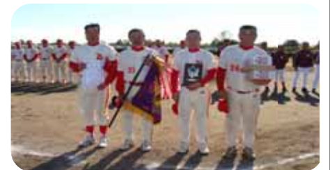
【賞状・優勝旗・盾・副賞の授与式】