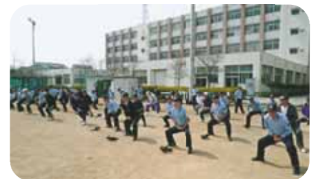
〔強風の中での実技講習〕