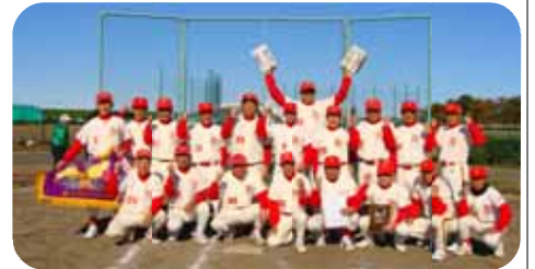
【14連覇・常勝軍団の浦和SG】