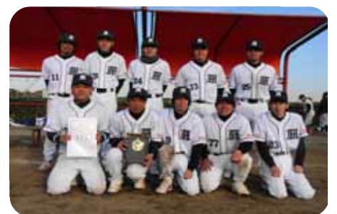
【準優勝の三橋6丁目チーム】

◎中々 春秋通じて良い成績が残せなかったのですが、やっと今シーズンは春季大会準優勝、市民大会で優勝することが出来ました。ありがとうございました。