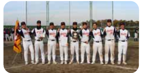
【初優勝のバトラーズ】