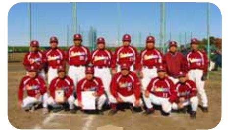
【準優勝の大宮レインボーズ】

◎試合に出る人、試合に出ていない人全員が、一つの目標に向かった結果が優勝に繋がったまとまりのあるチームです。