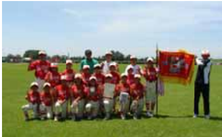
【小学生女子優勝常盤スポーツ少年団】

5点リードされた4回ウラ沼田の3塁打と三振り逃げと捕手悪送球・四球さらに短・長打で4点を挙げて1点差、2死後4番坪内三振の時振り逃げと捕手の1塁への悪送球が重なり2者がホームインし逆転サヨナラとなってしまった。大久保スポ小は初回に敵失で先制し、3・4回の好機には適時打も出て順調にリードしていただけにミスが非常に惜しまれる